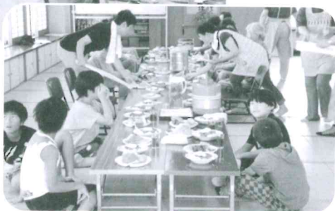
J A女性部が帝国ホテル風キーマカレーに 挑戦 子供達も招待し一緒に楽しい会食