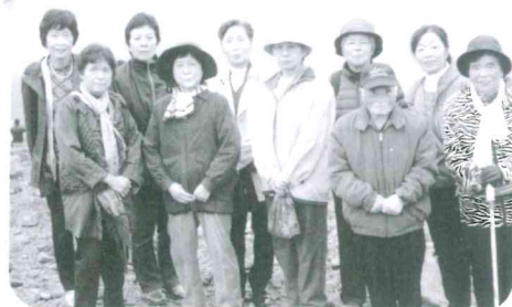
蔵王の「お釜」見学 一瞬霧が晴れてお釜が見え「ハイパチリ」