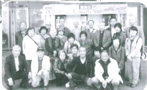
初めて山形メディアタワー見てきました